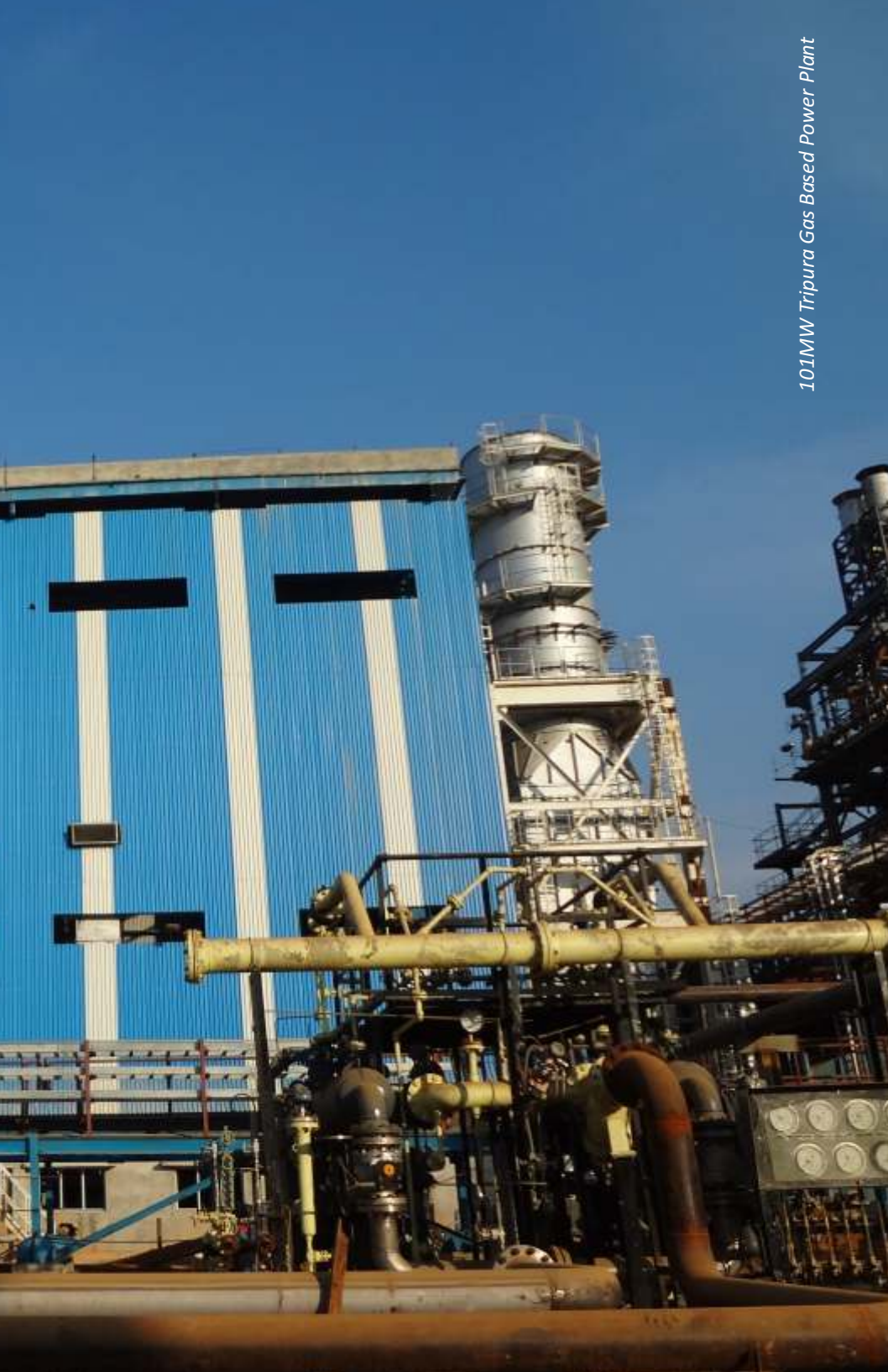
101MW Tripura Gas Based Power Plant