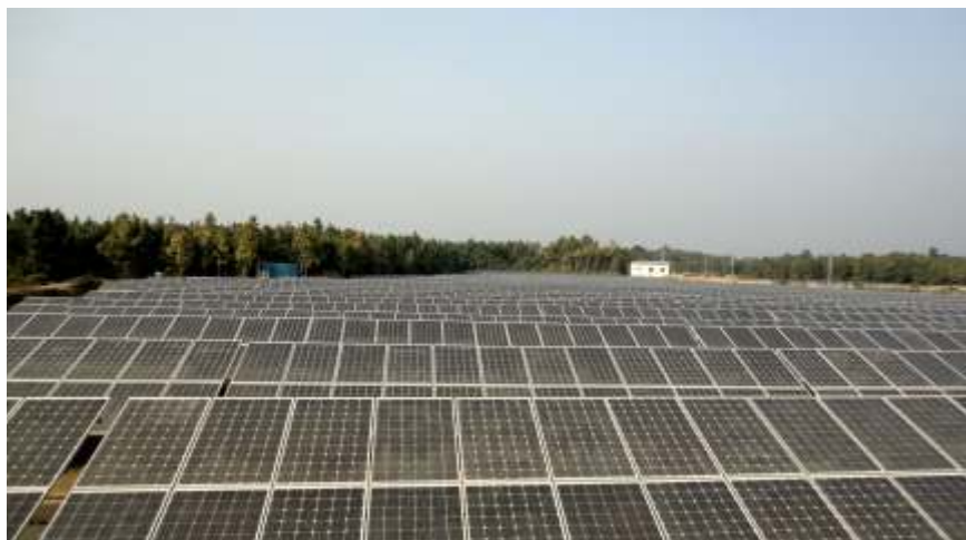
5 MW Solar Project at Monarchak, Tripura