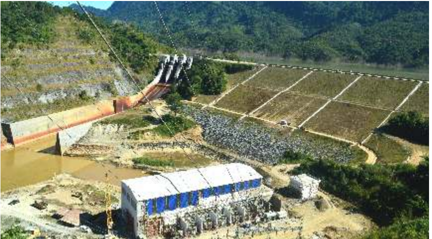
60 मेगावाट तुरियल जल विद्युत संयंत्र, मिजोरम